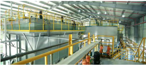
SIFLEX Viet Nam