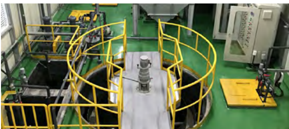
Daeduck Viet Nam