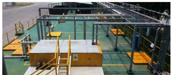
SIFLEX Viet Nam